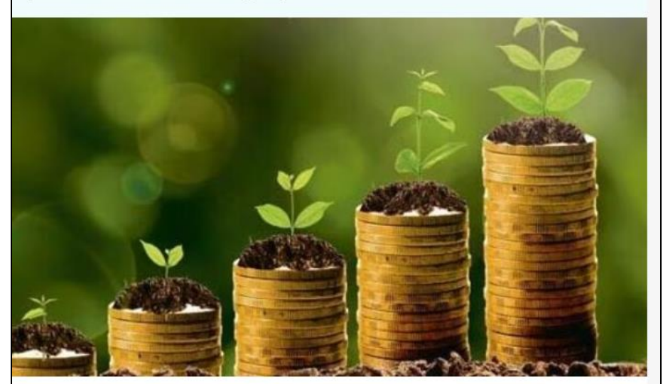
PNB MetLife India Insurance Company introduced the PMLI Small Cap Fund in the ULIP category.

poised to evolve into future large caps.