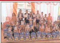
एक वित्तीय साक्षरता सत्र के दौरान, पीएनबी मेटलाइफ ने लड़कियों को वित्तीय साक्षरता पुस्तिकाएं वितरित कीं।

वित्तीय विनिर्देश प्रभावी और सक्षम जीवन की नींव रखते हैं। इन लड़कियों को वित्तीय साक्षरता पुस्तिकाएं वितरित करने के लिए प्रोजेक्ट नदी काले के नाम पर काम कर रहा है। यह कार्यक्रम इन लड़कियों को एक वित्तीय सुरक्षा अनुभूति किट वितरित करने के लिए प्रेरित करेगा और उन्हें जीवन का संभल बनाने में सक्षम करेगा।