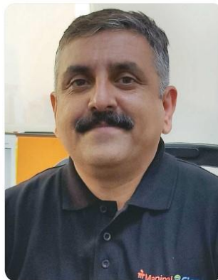
Shashank Chaphekar reveals a rise in demand for health covers among millennials & GenZ customers

Samrat believes that if a customer has purchased an investment-oriented plan in the first instance with a child’s education in mind, they are more likely to purchase